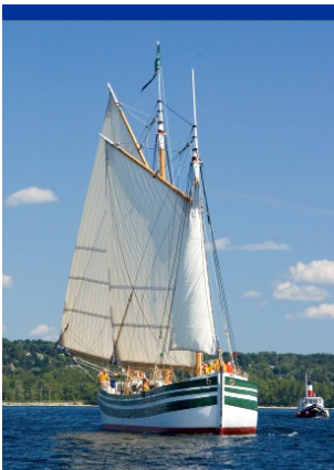
La goélette Lois McClure

Les Québécois représentent 96 % de nos visiteurs. Ils proviennent majoritairement de la Montérégie (56 %). Cette année, nous observons une augmentation de la clientèle provenant de la région de Lanaudière, soit 9,2 % de notre clientèle comparativement à l'été dernier où l'on en comptait 7,3 %.