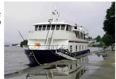
Ci-contre : le Latitude Amsterdam

Par ailleurs, un autre important bateau, le Latitude Amsterdam , qui combine le vélo à la navigation fluviale, a choisi de faire un arrêt à Sorel-Tracy lors de ses circuits du Roy et Champlain. Il a ainsi fait des escales au quai Richelieu du 3 juillet au 17 septembre derniers.