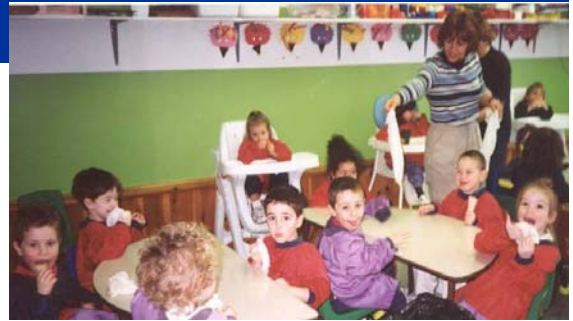
Le CPE des Marguerites, à Sorel-Tracy.

En effet, à la suite d'un plan de développement appuyé par la MRC du Bas-Richelieu et accepté par le ministère, on apprend récemment que ces places seraient distribuées dans trois CPE de la région — CPE des Marguerites, CPE La Marelle et CPE La Petite Marine — sans compter la vingtaine de places créées en milieu familial.