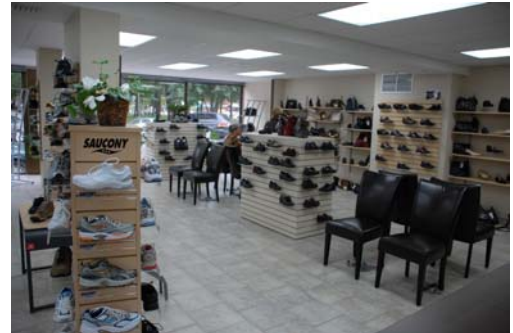
Les nouveaux locaux aménagés au premier étage de l'établissement.

L'entreprise sera en effet en mesure d'offrir des services variés dont un laboratoire complet d'orthèses et de prothèses et la vente de chaussures pour femmes, hommes et enfants.