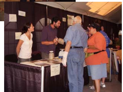
Ci-dessus : Éklat vitrail et Advitam, deux des entreprises exposantes.