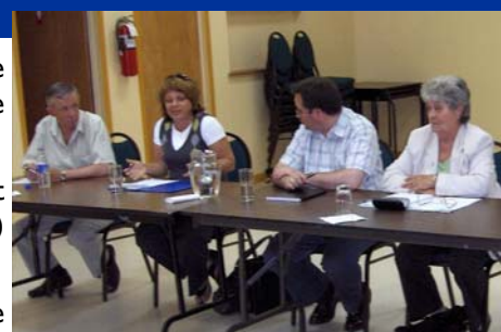
Des représentants du comité régional de la ruralité lors de la séance d'information qui a eu lieu à Sainte-Victoire-de-Sorel.

En plus de présenter les principaux éléments de la deuxième politique nationale de la ruralité, de préciser les enjeux visés par la MRC du Bas-Richelieu et d'expliquer la marche à suivre pour la présentation des projets, les séances permettent de connaître l'opinion des gens par rapport au programme.